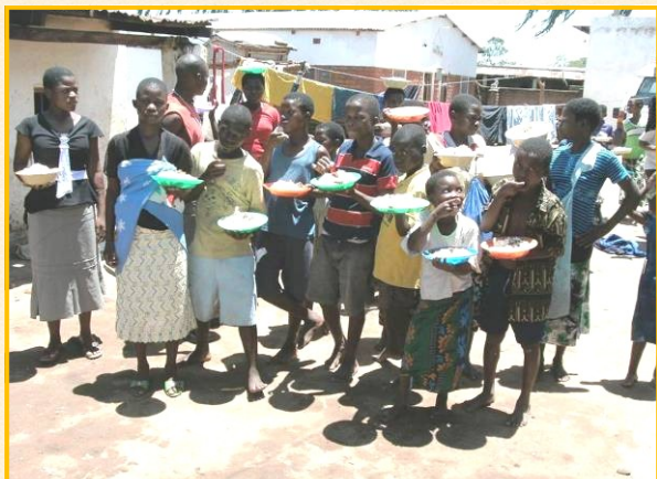
Comme vous le voyez, le plus dur est d'obtenir un sourire pour la photo.

Bonjour, j'espère que vous avez récupéré depuis les fêtes et que vous n'avez pas trop à vous plaindre des kilos gagnés. Il est vrai que la plupart d'entre nous mangeons trop à Noël. Et bien nous ne sommes pas les seuls : chaque enfant d'ARO avait l'estomac bien rempli et chaque tuteur était satisfait. Grâce à des dons généreux, surtout à l'occasion de Noël, nous avons pu en faire profiter tout le monde. Un jour mémorable pour les enfants et surtout pour les personnes âgées qui en ont la charge.